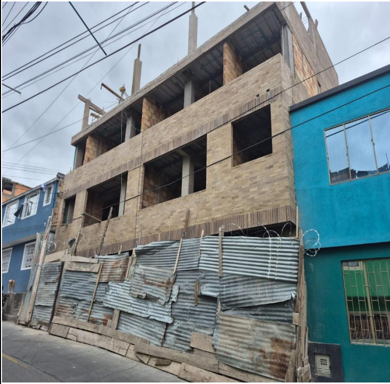
IMAGEN 3: FACHADA LATERAL