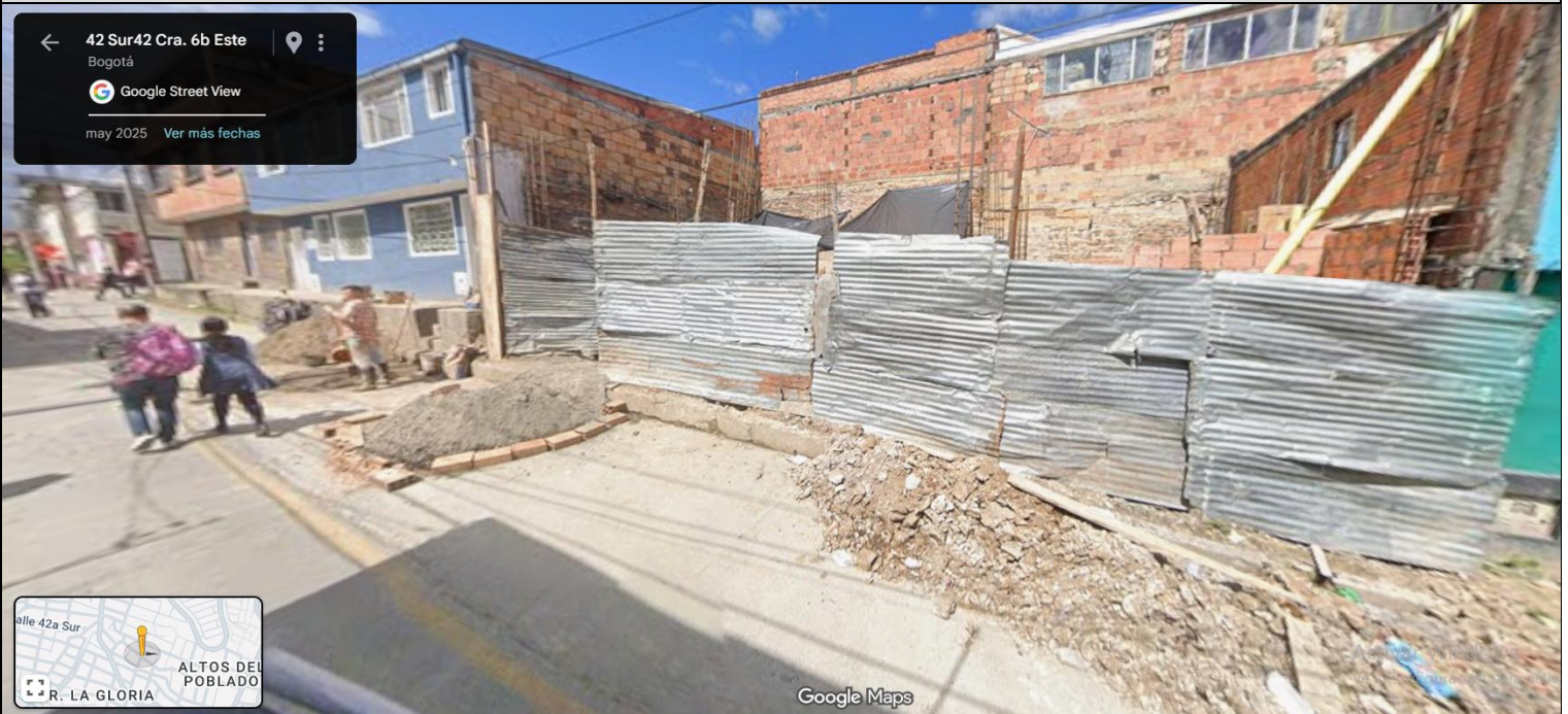
IMAGEN 1: NOMENCLATURA